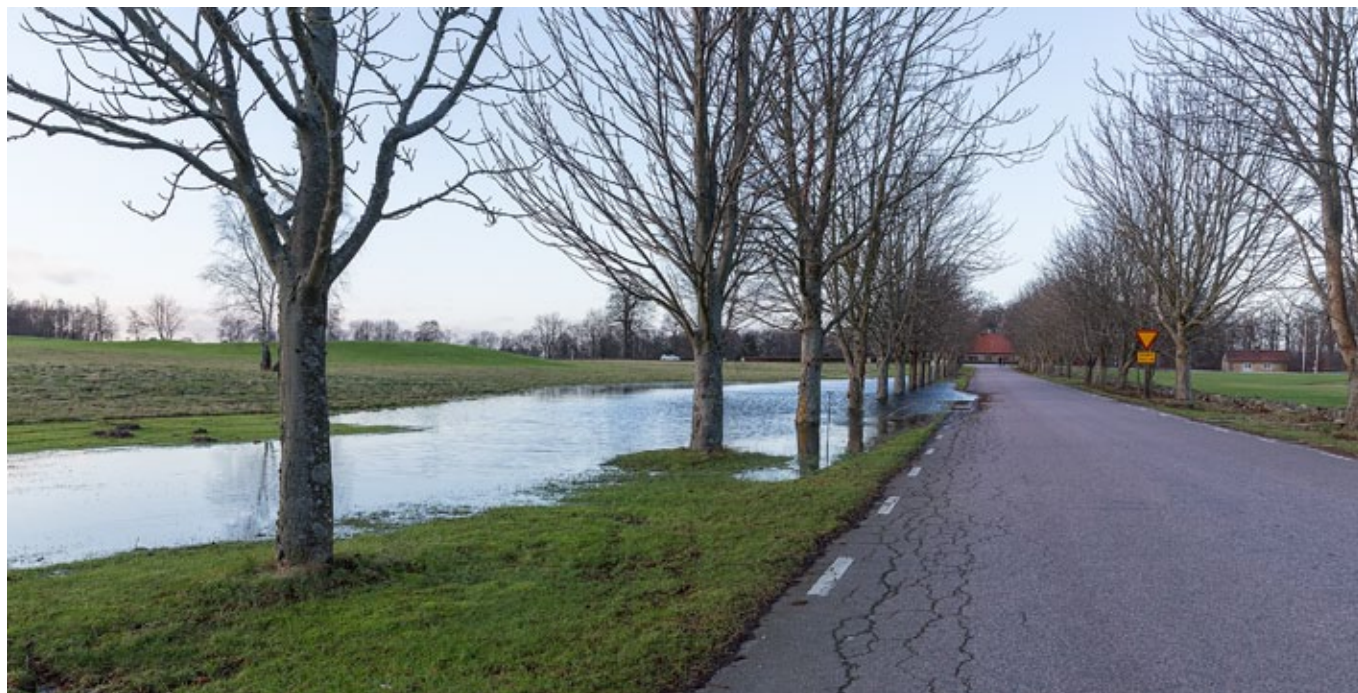
Infarten till Bosjökloster Golfklubb